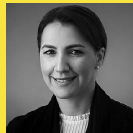
Марьям Аль Мехайри

Министр инноваций и технологического развития Сербии