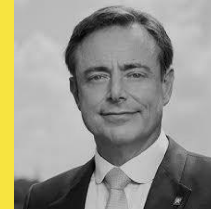
Барт де Вевер

Министр продовольственной безопасности ОАЭ