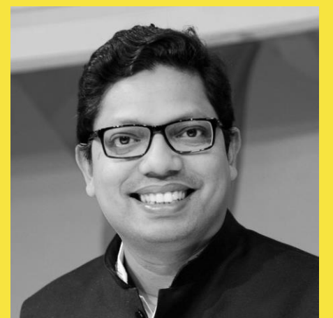
Ахмед Зунаид Поллок

Министр информационных технологий и телекоммуникаций Бангладеш